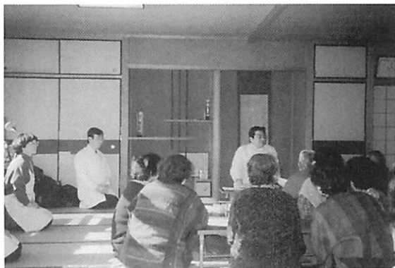
老人クラブにおける口腔ケア勉強会

念を、県民のみなさんに広く知っていただき、また口腔ケアを十分に理解していただくことを目的として、昨年十月、徳島県歯科医師会のなかに「口腔ケア支援センター」を設立いたしました。 要介護者への口腔ケアについて、個人的なご質問やご相談、在宅・施設訪問歯科診療のお問い合わせ、老人クラブ勉強会や施設職員研修会などのご依頼は、左記まで。