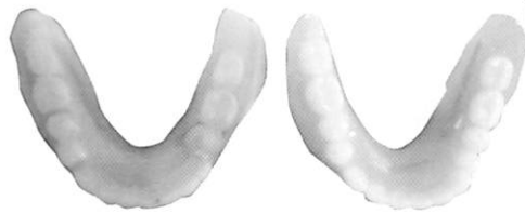
(写真2) 入れ歯はそれぞれ違うので、入れ替えは、ダメです。

入れ歯はそれぞれ違います。1つの入れ歯を自分に合ったように調整しながら使用することが重要です(写真2)。入れ歯が痛くなったから、と簡単にス。ヘアに入れ替えず、かかりつけ歯科医を受診してください。