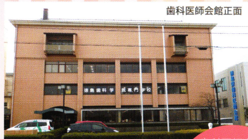
歯科医師会館正面